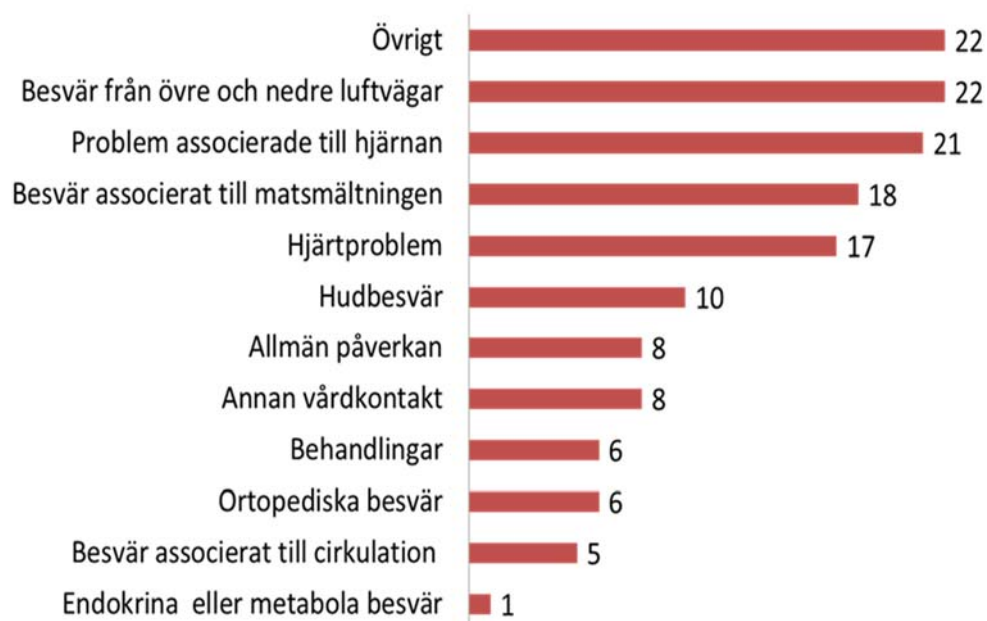
Figur 3. Antal uppdrag inom projektet "Samverkande sjukvård", 2012 fördelade på huvudgrupper av kontaktorsaker enligt Blankett B.

hjärnan” 21 uppdrag och ”Besvär associerade till matsmältningen” med 18 uppdrag. Tittar man däremot på de kontaktorsaker som angetts via 1177 under perioden 2010-12 så toppar ”Besvär associerat till matsmältningen” med 37 uppdrag (Figur 4), följt av ”Ortopediska besvär” med 26 uppdrag och ”Besvär associerade till hjärnan” med 24 uppdrag.