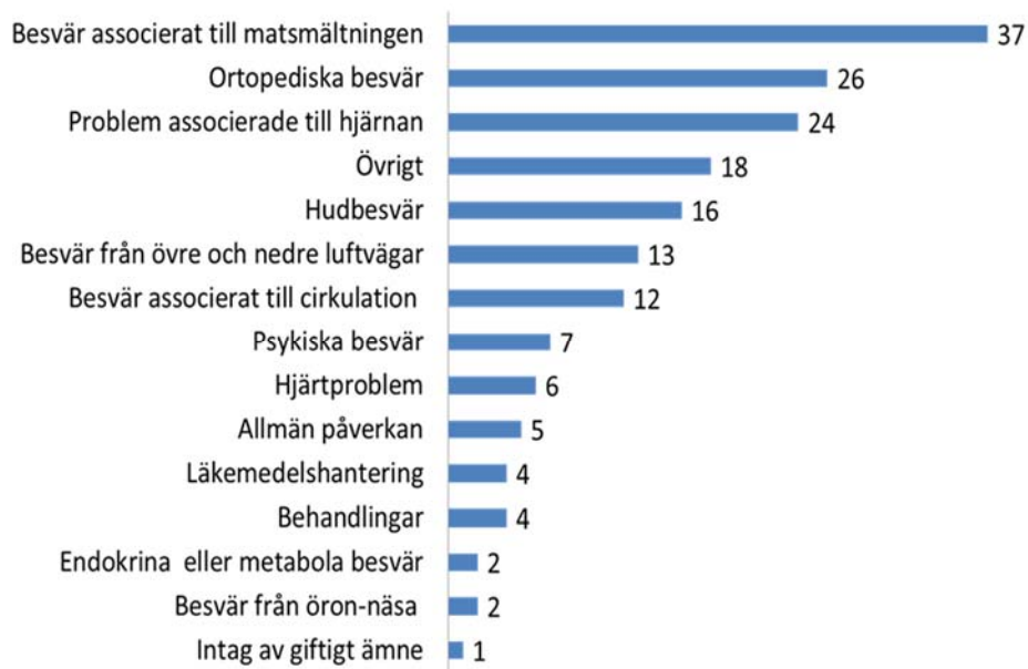
Figur 4. Antal uppdrag inom projektet "Samverkande sjukvård" via sjukvårdsrådgivningen (1177), 2010-12 fördelade på huvudgrupper av kontaktorsaker, källa 1177.