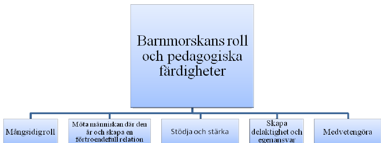
Tabell 2. Tema nummer 1 i resultatet.