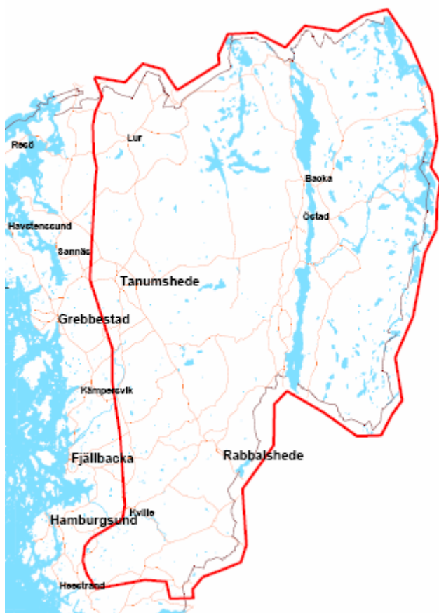
Figur 1. Landsbygdsområdet.