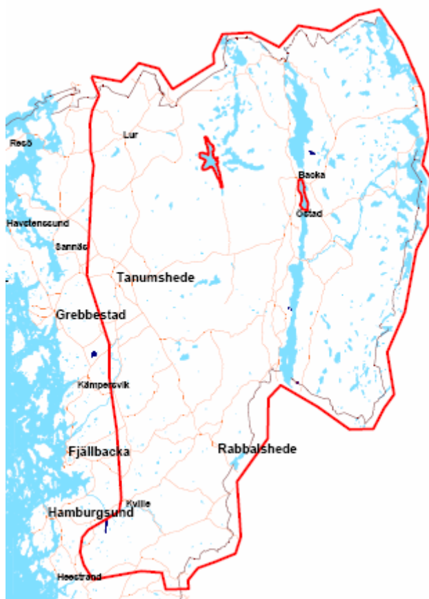
Figur 4. Områden för fördjupad analys.

Valen är att betrakta som en avgränsning som är nödvändig på grund av praktiska begränsningar som tid och resurser. De två områdena är emellertid valda utifrån ambitionen att pröva metoden på realistiska men inbördes olika områden.